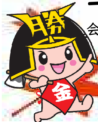
勝央町マスコットキャラクターきんとくん