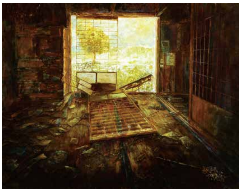
<光の在処> 2018 麻紙、岩絵具、水干絵具 910×1167mm