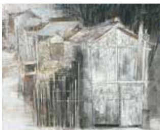
<町> 2014 麻紙、岩絵具、水干絵具 1300×1620mm

日本画壇創画会会友 京都日本画家協会会員 真庭市アートグループ MO 所属 岡山県美術展覧会委嘱作家