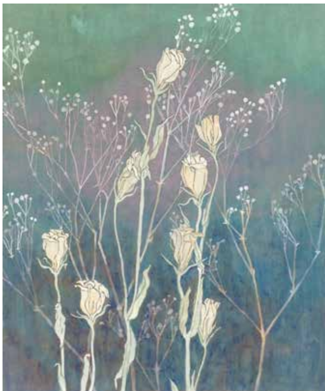
<悠> 2018 麻紙、岩絵具、水干絵具 455×380mm