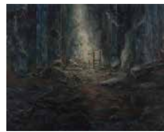
<その足下を照らしてあげよう> 2018 麻紙、岩絵具、水干絵具 1818×2273mm