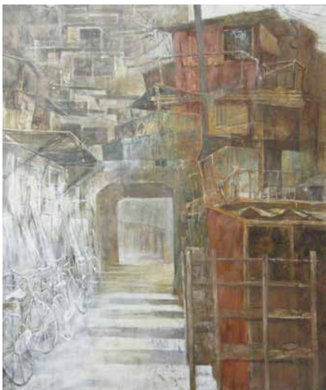
<町> 2011 麻紙、岩絵具、水干絵具 1620×1300mm