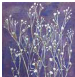
<かすみ草> 2018 麻紙、岩絵具、水干絵具 142×142mm