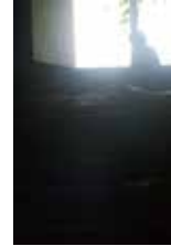
矢内 早由紀 (やない さゆき)